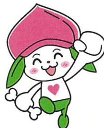
協会けんぽ福島支部マスコットキャラクター ケンタくん